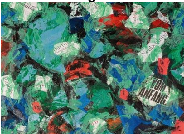
Das Misereor Hungertuch 2023 “Was ist uns heilig?” von Emeka Udemba © Misereor.